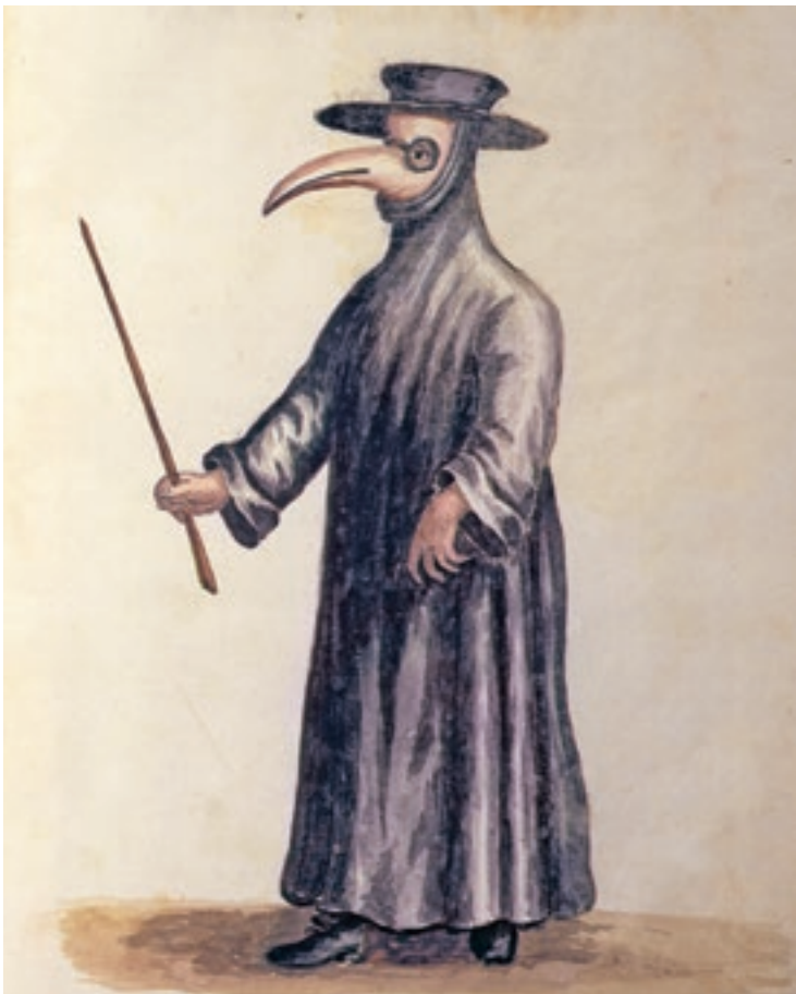
Un monatto della peste del 1630

re il clima del momento; mi piace, invece, ricordare la dedizione del personale sanitario, attivo fino allo stremo, fino al sacrificio e noncurante degli orari di servizio (il numero dei nostri sanitari infettati dal Coronavirus e deceduti è ben più alto di quello dei pur eroici sanitari cinesi colpiti dal Covid-19). La sanità italiana, spesso volte descritta sommariamente come “malasanità”, ha evidenziato il lato più generoso della professione medica. Purtroppo ci si accorge solo ora che mancano i medici, gli infermieri, gli operatori sanitari; ma questo è conseguenza di scelte remote (come il numero chiuso alle facoltà di medicina) o più recenti, dettate da accorpamenti di strutture ospedaliere, effettuate per necessità di bilancio. Sono mancati i posti in terapia intensiva e si sono allestiti in pochi giorni nuovi ospedali, sono mancati i necessari presidi sanitari (anche grazie ai vari cugini europei che ne hanno intralciato l’espatrio verso l’Italia), sono mancate le sepolture nei cimiteri e si è fatto ricorso a una drammatica traslazione di massa verso luoghi meno saturi.