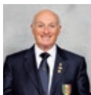
di GIAMPIERO PEDDIS

Nei club abbiamo tante potenzialità; alcune dormienti, altre assopite. Scoprir-