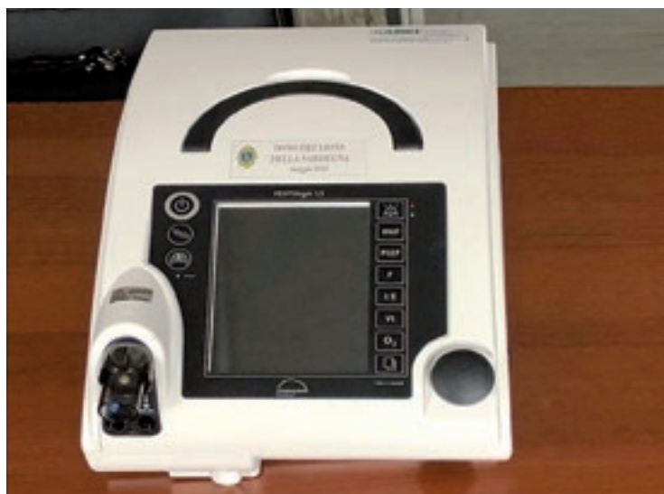
Uno dei ventilatori polmonari donati in Sardegna

D a un giorno all'altro, per decreto, ci siamo ritrovati rinchiusi a casa, senza alcuna possibilità di movimento. La situazione è risultata da subito catastrofica per il picco di morti e contagiati che pareva non fermarsi mai. Non avendo la possibilità di intervenire di persona sul territorio, l'unica strada per agire è stata quella di mettere mano al portafoglio con una raccolta fondi destinata all'emergenza del territorio e dare così il nostro contributo alle tre regioni che, terrorizzate, necessitavano ogni giorno di più di aiuti.