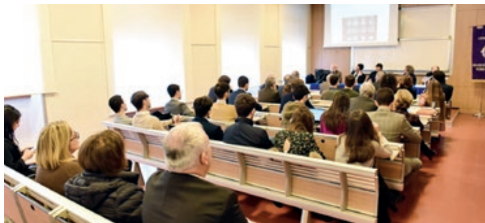
Una folta platea ha seguito con attenzione l'interessante dibattito

In certi settori il futuro è già qui, basti pensare che la figura, un tempo importantissima e discrezionale del direttore di banca, oggi è diventata inutile poiché le funzioni decisionali sono lasciate all'informatica. L