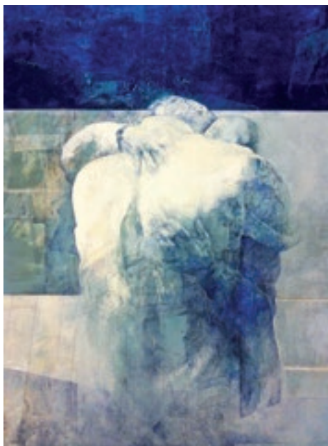
L'abbraccio, una delle azioni che ci è mancata di più Pedro Cano: Abbraccio di Giovanni Paolo II con il Cardinale Wyszyński

Siamo riusciti spontaneamente a dar corpo e vita a quel motto di servizio che ci è proprio. Mille e più iniziative sono fiorite in ogni angolo dell'universo lions in favore e in soccorso dei nostri concittadini flagellati da una virale emergenza che ha colpito duro e colpirà ancora più duro dal punto