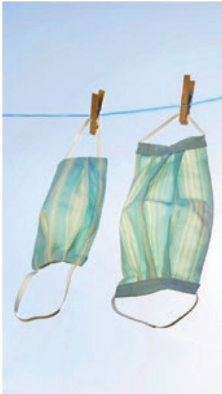
Le introvabili mascherine