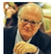
di NORBERTO CACCIAGLIA

La peste manzoniana e le similitudini con l'attuale pandemia