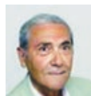
di SERGIO FEDRO

Ma come un comune cittadino poteva difendersi dal contagio? Prima di tutto, l’ho detto, isolandosi in casa e stando a più di