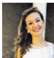
di ARIANNA PERNA

Si è dato spazio ai relatori e a tutti i partecipanti, Leo e non, che avessero voluto portare le proprie testimonianze in fatto di service e progetti