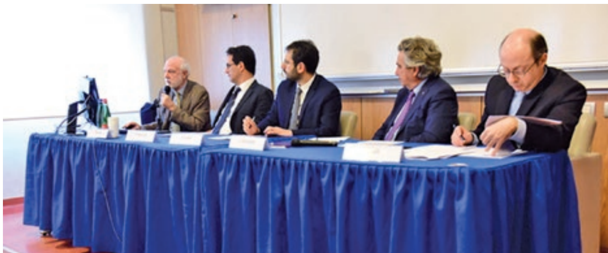
Il tavolo dei relatori al convegno sull'intelligenza artificiale

Da un simposio alla Luiss sono emerse aspettative straordinarie e interrogativi inquietanti sui progressi della ricerca scientifica