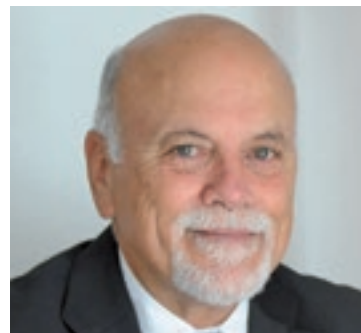
Silverio Forteleoni Lions Club Calangianus