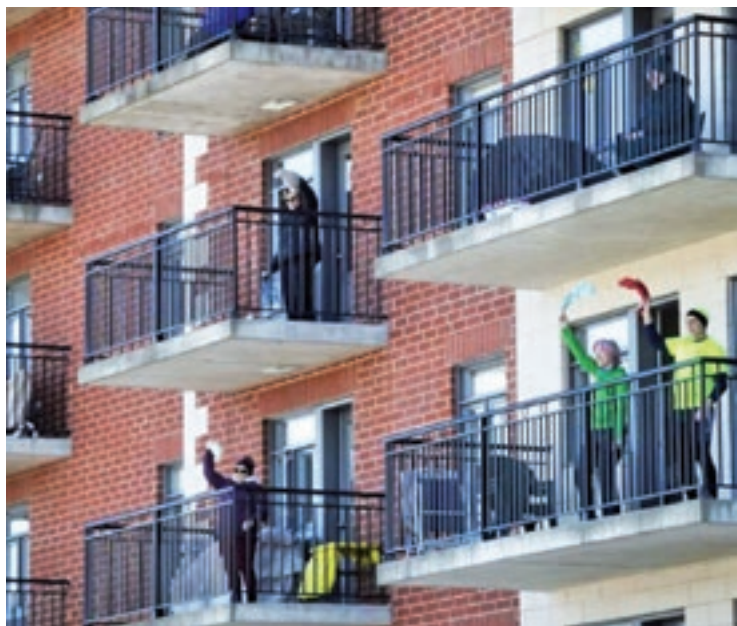
Canti improvvisati dai balconi

le proprio perché utile anche per Nazioni con economie più forti e con un minore debito pubblico.