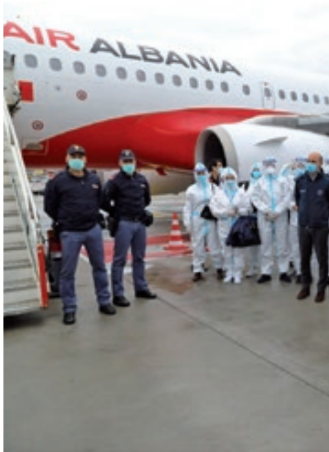
L'Albania invia una squadra di medici e infermieri in aiuto all'Italia