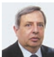
di ALBERTO VALENTINETTI

A Seveso quarant'anni fa il primo grave disastro ambientale