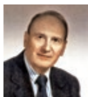
di VINCENZO FRAGOLINO L.C. Roma Pantheon