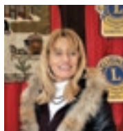
di DANIELA MATTIUZZO BRUNETTA

Che dire della ricerca affannosa di mascherine, gel mani e guanti? Vado di persona a ritirare gli ordini, per fare prima; sovente sostando in file chilometriche. Ma, così facendo, sono certa di portare in farmacia gli strumenti di protezione indispensabili per la prevenzione dal virus.