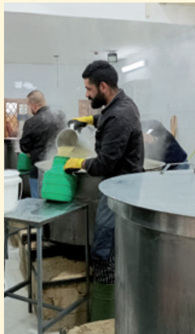
Distribuzione zuppa, Al-Takiyya, Hebron

possibilità di costruire ponti di comprensione e sostegno reciproco tra le genti.