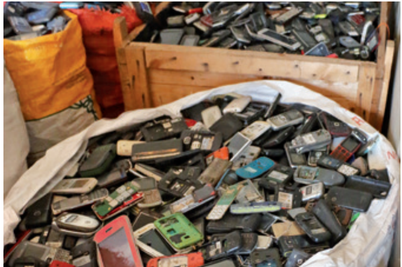
I rifiuti elettronici vanno gettati nelle aree designate, in modo che la vecchia tecnologia possa essere riciclata nel giusto modo

«Nel senso che arriveremo in un centro RAEE!»