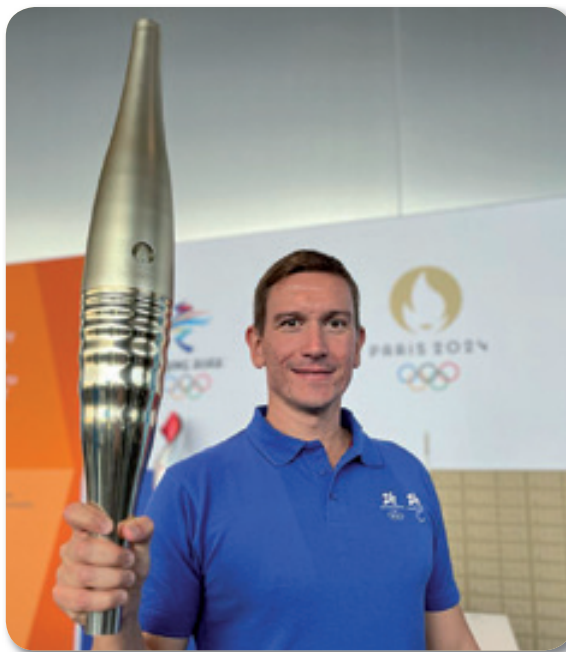
Damiano Lestingi, già pluricampione italiano di nuoto, olimpico di Pechino 2008, vice campione d'Europa ed ex primatista italiano. Olympic Torch Relay Manager del comitato organizzatore di Milano Cortina 2026

Il periodo sul valore dello sport non è stato aggiunto a caso all'interno di tale articolo, bensì è figlio di un dibattito di più ampio spettro tra chi voleva affiancarlo all'articolo 32, quello sulla tutela della salute, chi sull'istruzione. Dopo anni, anzi, decenni, si è voluto unirlo, come in un matrimonio naturale, a quel valore sociale che l'istruzione porta con sé. E qui vengo al nocciolo della questione. Da anni noi Lions ci adoperiamo in lungo e largo per i Distretti, dalla Valle d'Aosta alla Sicilia, entrando nelle scuole per insegnare e promuovere l'educazione civica. Invitiamo questori, artisti, agenti di polizia, professori universitari, persino astronauti e musicisti. Eppure, faccio fatica a rintracciare sportivi. Si badi bene. Alcuni club li invitano. E le loro lezioni, mi dicono, sono entusiasmanti. Persone, ragazzi o ragazze che hanno fatto della loro giovane vita un esempio da seguire. Inse-