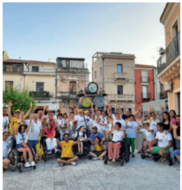
Al Campo Italia giovani disabili in Sicilia

"Sono un grande appassionato di Walt Disney. I preferiti come personaggi sono Lilo e Stitch . In assoluto è proprio Stitch è il mio personaggio prediletto. È uno dei preferiti per il messaggio, quello che significa, che simboleggia e che racconta. Stitch è un alieno fondamentalmente cattivo che viene accolto come cane domestico da una famiglia hawaiana, dove c'è questa bambina che si chiama Lilo. Lui pensa a scappare, poi si affeziona a quella famiglia. E, mentre lo stanno per portare via, dice a Lilo: Ohana , che significa famiglia. Penso che ognuno di noi abbia due famiglie: quella in cui nasce e quella che si sceglie; i Leo sono la famiglia, la mia Ohana , che ho scelto, nella quale sto bene. Per cui ecco perché Stitch è la mia mascotte." ■