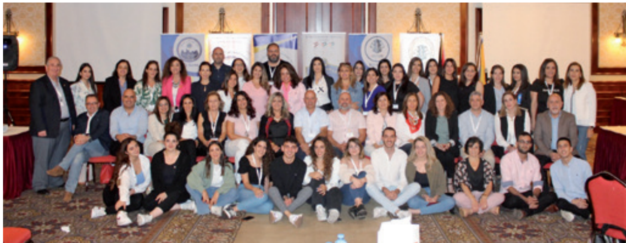
Lions e Leo palestinesi

nessione che va oltre le barriere geografiche e culturali, aprendo nuovi orizzonti.